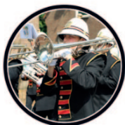
Show- en Marchingband