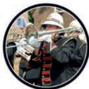
Show- en Marchingband